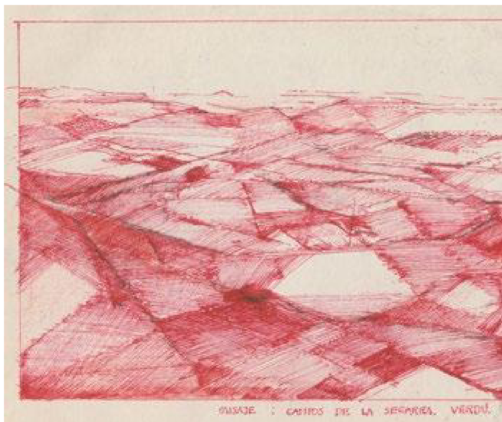
LLIBRETA DE VIATGES. Bona part de la seua obra són retrats dels espais i els paisatges que frequenta. A la part superior, el paisatge de Verdú pintat amb bolígraf vermell.