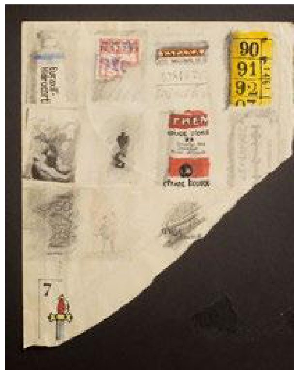
GEOMETRIA. En algunes obres menors l'artista utilitza els escaires per fer els seus dibuixos figuratius.