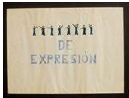
POESIA VISUAL. Una de les facetes més interessants de l'artista lleidatà són els poemes visuals que ara són al Morera.